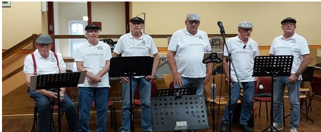
De Irish Friends

Als eerste bracht het Enclavekoor een deel van hun repertoire ten gehore, gevolgd door de heren van Irish Friends die hun typisch Ierse songs a capella ten gehore brachten. De Kleurrijke Mama's uit Tilburg hadden een verrassende wijze van verhalen vertellen. De teksten waren bijzonder en de eigen muzikale begeleiding zorgde voor een vrolijk geheel. Het aanwezige publiek heeft genoten van de diversiteit aan liedjes en er werd vaak meegezongen.