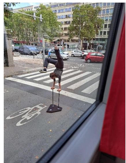
Vanuit de bus voor het stoplicht

Een psychedelische roltrap bracht je naar de bol met bijzondere effecten. Er waren verder wel veel trappen die niet voor alle deelnemers te belopen waren. Maar er was overal zoveel te zien dat dit geen belemmering vormde.