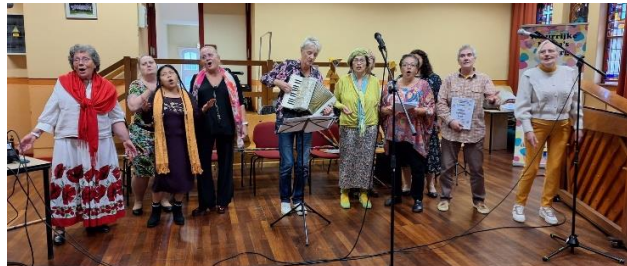
en de Kleurrijke Mama's

Het Enclavekoor start binnenkort al weer met het oefenen van kerstliedjes. Iedere vrijdag om 19.30 uur ben je van harte welkom om kennis te maken met ons koor in de De la Salle zaal.