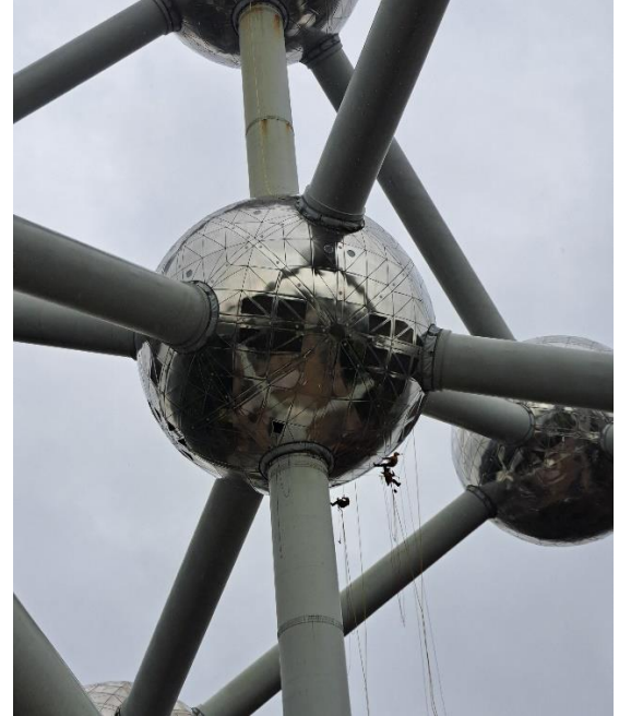
Er werd volop aan de bollen gepoetst

De reis begon goed. Zonder al te veel files arriveerden we bij de eerste stop, Lunchgarden Zemst, voor naar we hoopten een lekker kopje koffie. Ondanks diverse contacten vanuit de werkgroep, was het personeel van dit cafetaria niet op de hoogte van ons bezoek. Bovendien waren er meerdere koffieautomaten buiten werking, dus werd het een hele toer het beloofde kopje koffie te bemachtigen. Maar het smaakte wel lekker.